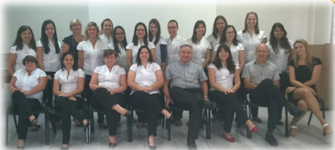
Equipe NR Contábil

A empresa ganhadora do brinde sorteado entre as empresas que devolveram as avaliações foi: