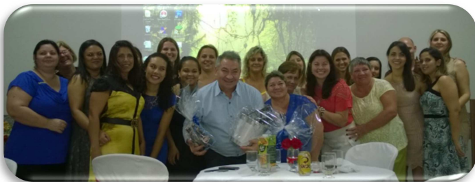
Equipe NR Contábil